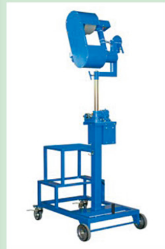
図2 バレーボールマシン