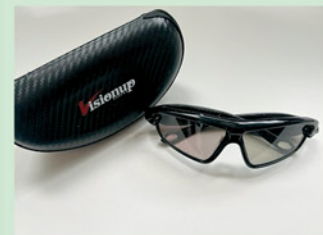
図1 シャッターゴーグル