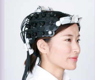
図2 Spectratech,OEG-17APD [1]