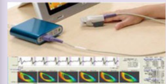
図3 CCI BACS-Advance [2]