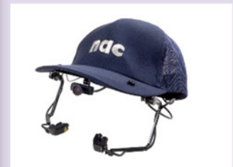
図4 Nac image Tech. EMR-9 [3]