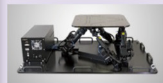
図7 COSMATE MB-150 [6]