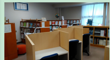
パーティション付学習デスク（図3）