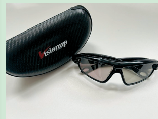
図1 シャッターゴーグル