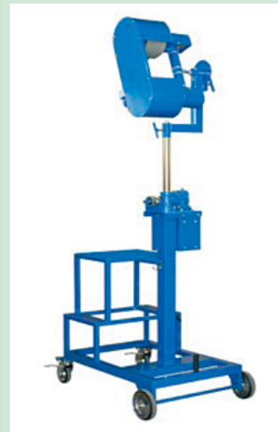
図2 バレーボールマシン