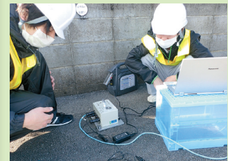
図2 現地調査の様子