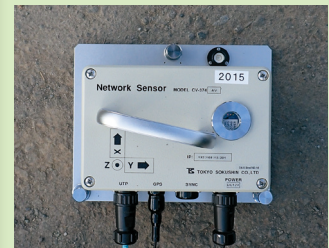
図1 微動計測機器（加速度計内蔵ネットワークセンサ）