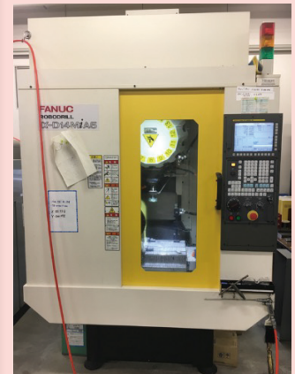
図7 3軸自動研磨装置（自作機）