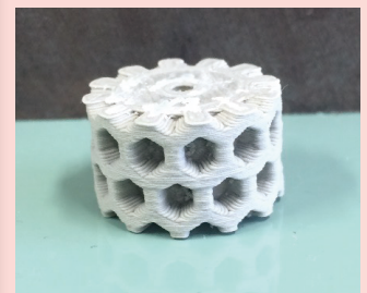
図3 チップポケットの大きさを制御できる3Dプリンタ製砥石