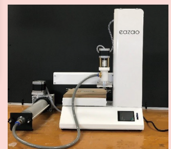
図8 粘土の積層が可能な3Dプリンタ