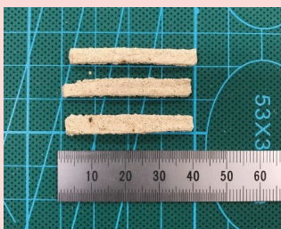
図9 3Dプリンタで作製したホーニング砥石