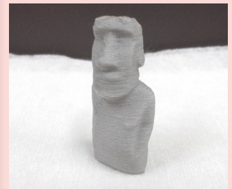
図1 3Dプリンタで作製した総形砥石