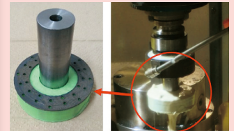
図2 3Dプリンタで作製した内部に研削液の流路を持つ砥石