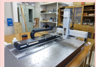
図6 3軸自動研磨装置（自作機）