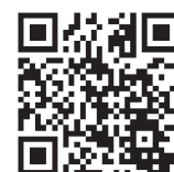
機構ホームページ

※ 本制度により本校以外の会場で受験が可となった入学志願者が「Ⅱ-D 追試験」に記載の追試験対象者となった場合も、本校ではなく、本制度の会場での受験となります。