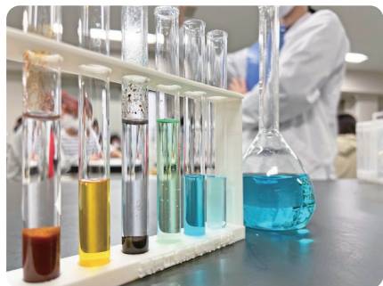
▼物質工学科 試験管の中のSDGs ～水をキレイにする化学反応を体験しよう～