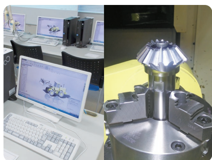
▼機械工学科 機械工学科まると体験ツアー