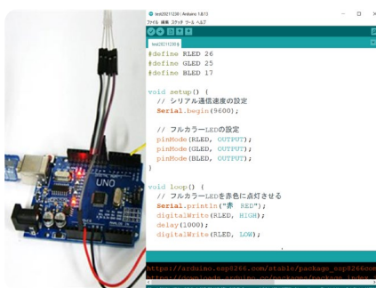
▼電気電子システム工学科 組込システムに挑戦!