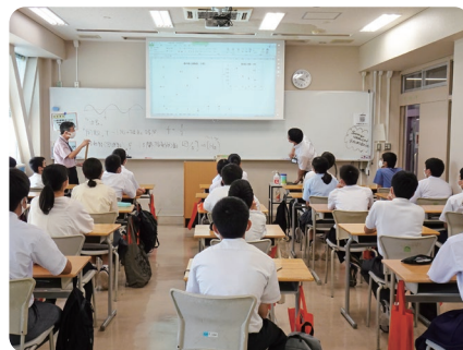
▼一般科目(一般教育科) ・高専の物理教室 ・高専の数学ってどんなの?