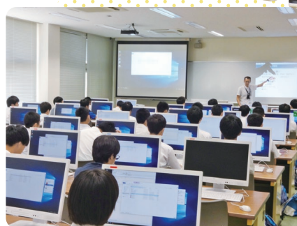
▼電子制御工学科 プログラミングを体験しよう!