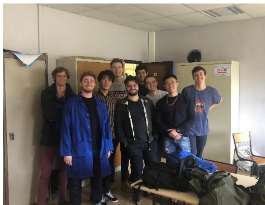
授業を一緒に受けた学生たち