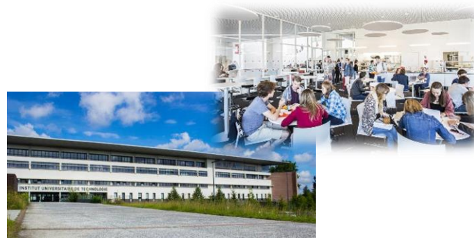
IUT A de Lille 校舎