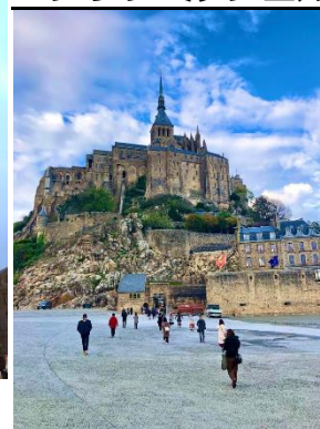
モンサンミッシェル