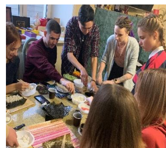
おにぎりパーティー