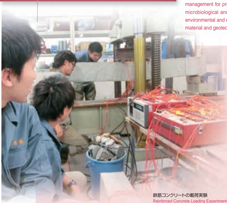
鉄筋コンクリートの荷重実験 Reinforced Concrete Loading Experiment

The Advanced Course of Civil Engineering provides the graduates of Civil, Environmental, and Urban Engineering Departments with opportunities for further in-depth learning, both fundamental and applied, in these disciplines. Courses are offered in a wide range of subjects covering: the planning and construction of urban and transportation infrastructures; development of material and construction practices for civil structure; environmental evaluation and improvement of air, water and earth quality; disaster management for protection against snow and ice, earthquakes, and floods; microbiological and water treatment engineering applications specific to environmental and energy issues; and, advanced theories and techniques in material and geotechnical engineering, hydraulics and planning.