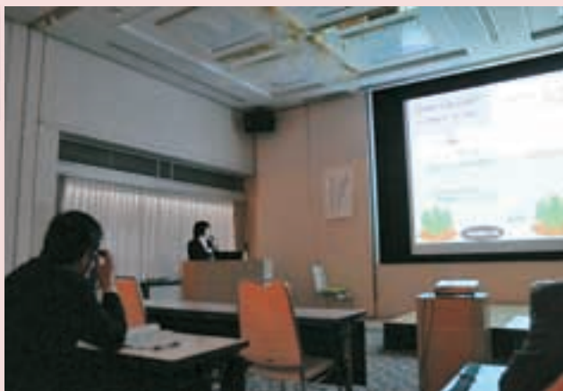
専攻科特別研究発表会(2年、口頭発表) Research report association of advanced Course (Oral session)