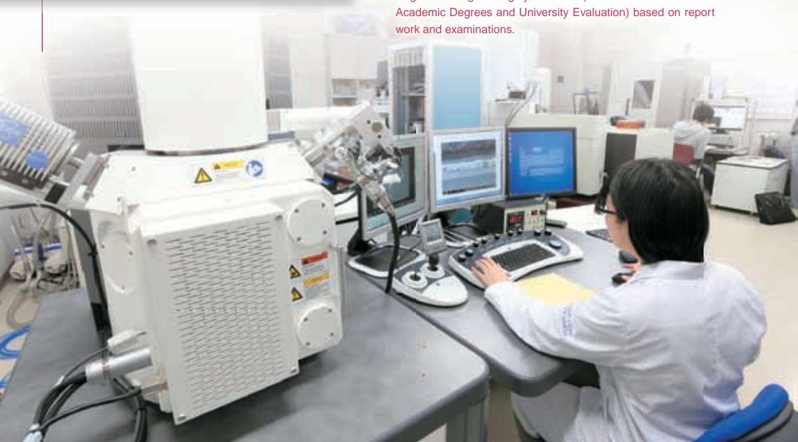
極低加速電圧SEMによる材料評価 Analysis by Ultra Low Vacc Type FE-SEM

Graduates from the Advanced Course are granted Bachelor Degrees in Engineering by NIAD-UE (the National Institution for Academic Degrees and University Evaluation) based on report work and examinations.