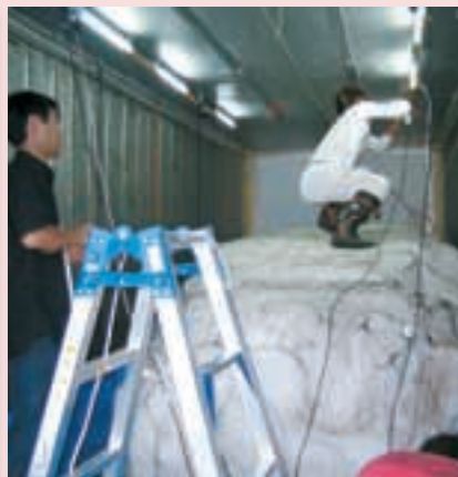
保冷コンテナ式貯雪庫からの冷熱取り出し実験 Experiment on the Cooling Energy Extraction from the Stored Snow