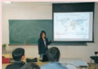
学会発表練習 Presentation Practice