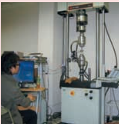
機能性材料の疲労強度実験 Fatigue Strength Experiment of the Functional Material