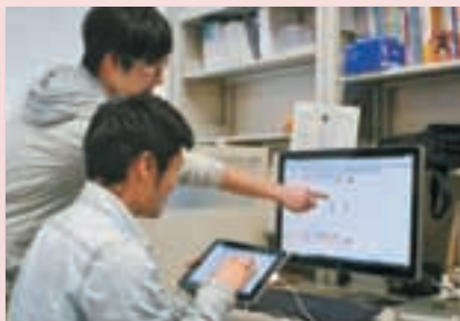
タブレット端末を使った橋梁点検システムの開発 Development of Bridge Inspection System with Tablet PC