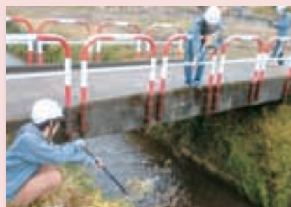
橋梁の概略点検 Inspection of Existing Bridge