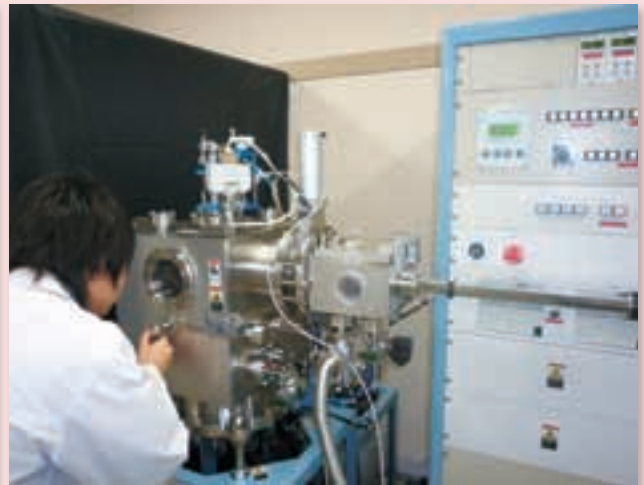
モバイル端末ディスプレイ向け有機EL素子の作製実験 Development of OLED Device for Mobile Terminal's Display