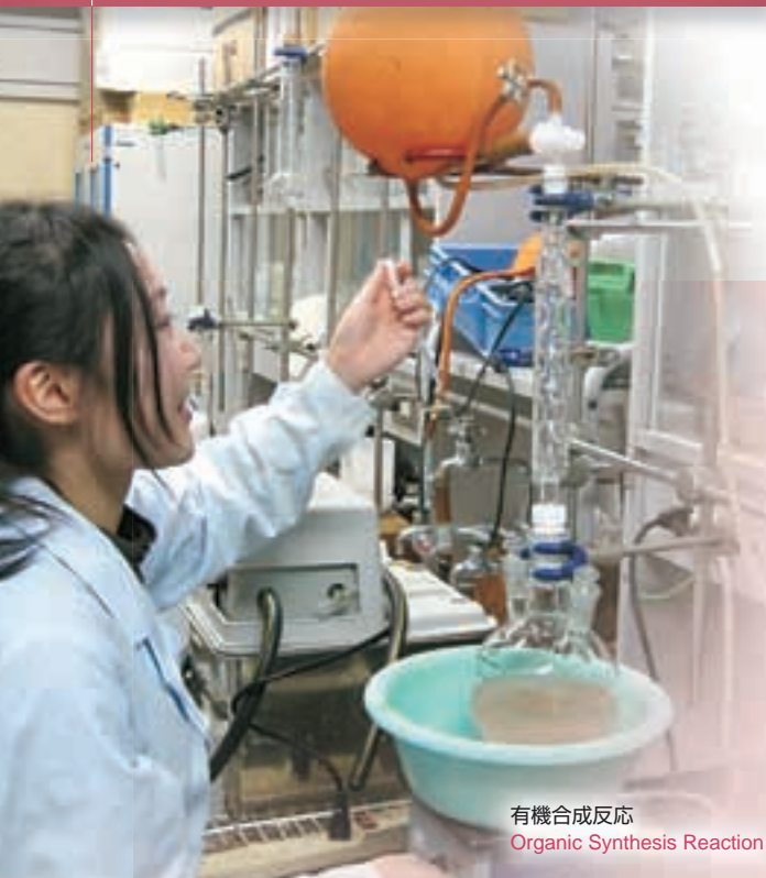
有機合成反応 Organic Synthesis Reaction

In the increase of the environment consciousness, social needs shift to development and design of the manufacturing process of the product assuming the low environmental loading and the resource recycling. Knowledge and technology of the wide field are required in addition to the speciality of the chemistry in important new material development field as a base of the industry development. In the Material Engineering Advanced Course, students will study deeply the field of material engineering on development and production of the new material and the field of biotechnology which applies the biofunction to substance production on the basis of the scholarship acquired in materials engineering course and applied biochemistry course of the department of materials engineering. By raising these technical knowledge, the practical engineer who can deal with development of the functional new material and development of the manufacturing process technology is trained.