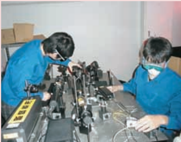
フォトポリマーを用いたホログラム記録実験 Experiment of holographic recording using photopolymer films

Today's electronic control engineers need an eclectic knowledge of mechanics, electronics and computers if they are to be successful in designing, producing and developing advanced industrial products, electric products, cars, and computers. The Department of Electronic Control Engineering trains and educates students to become engineers who will work actively in various areas of design, production and development of many advanced industrial products. The curriculum of the department, which is open to all students, consists of programs that deal with the following: Measurement Technology, Control Engineering, Mechanics, Electronics and Computer Science. The programs include many basic subjects which relate to Mathematics, Physics, and Information Processing.