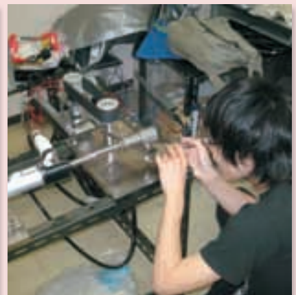
小型船舶における舵角システムに関する研究 Study on Rudder Angle Servo System for Pleasure boats