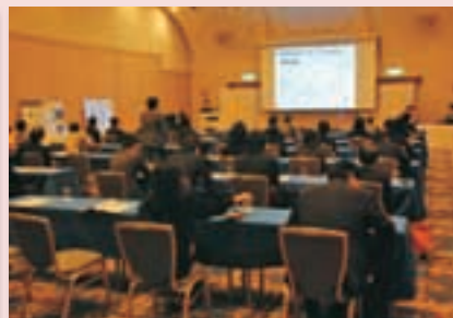
専攻科発表会 Research Report Association of Advanced Course