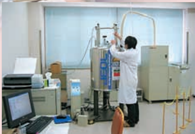
超伝導核磁気共鳴装置 Superconductive nuclear magnetic resonance