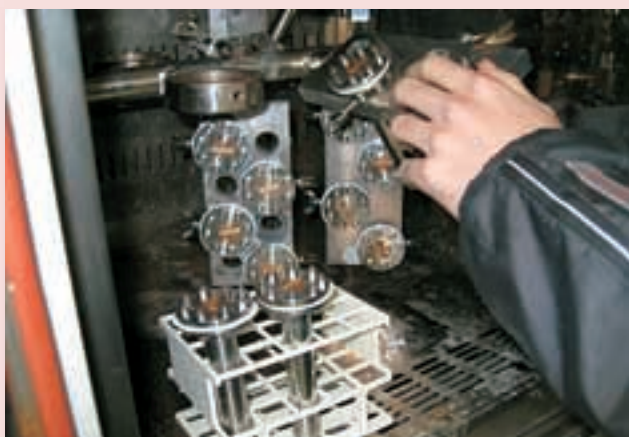
水熱合成反応 Hydrothermal Synthesis