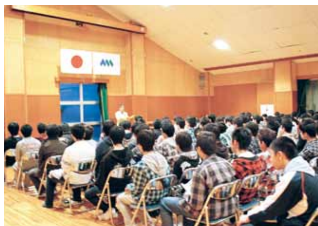
新入生合宿研修 Orientation Camp for the 1st year students