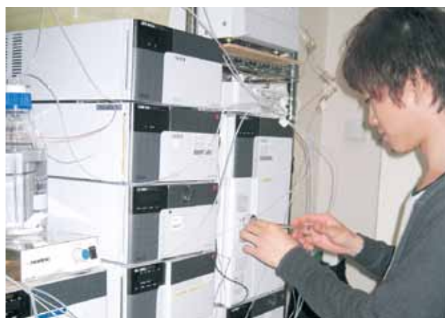
高速液体クロマトグラフィー High performance liquid chromatography