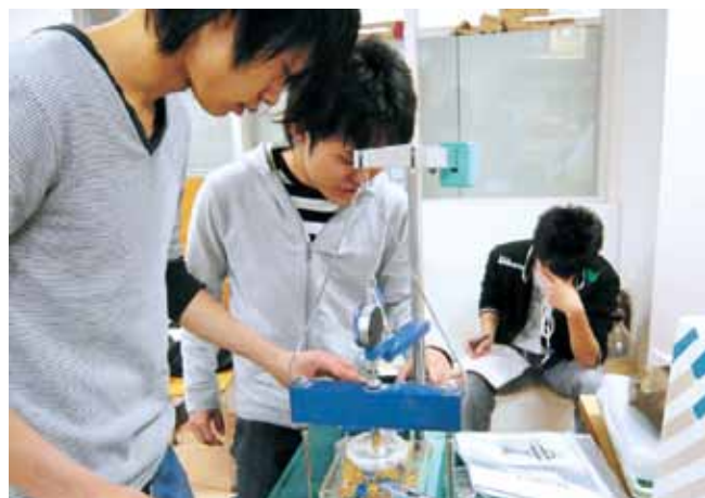
土質実験 Soil Engineering Experiment