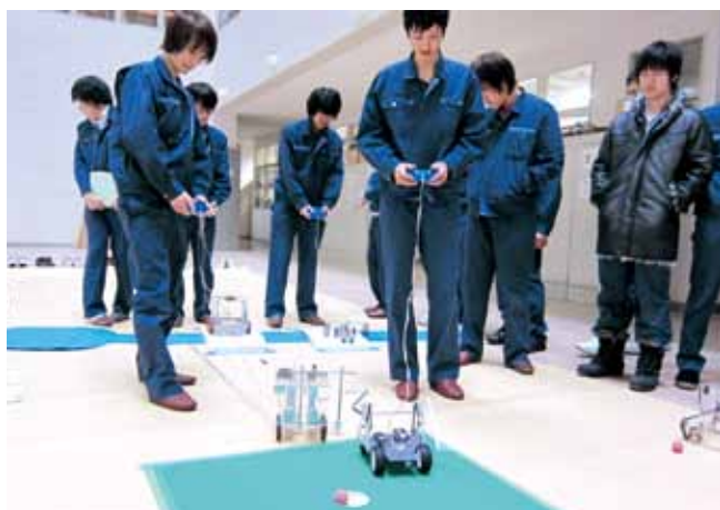
ゴルフロボットの設計・製作（総合製作・3学年） Golf Robots (Creative Design and Manufacture, 3rd grade)