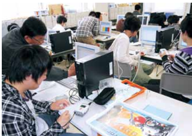
組み込み制御技術の実験（3学年学生実験） Experiment on Embedded Control technology