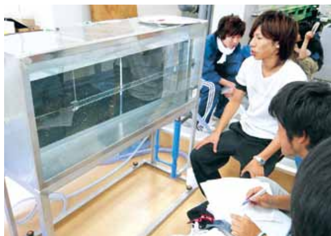
水理実験 Hydraulics Experiment