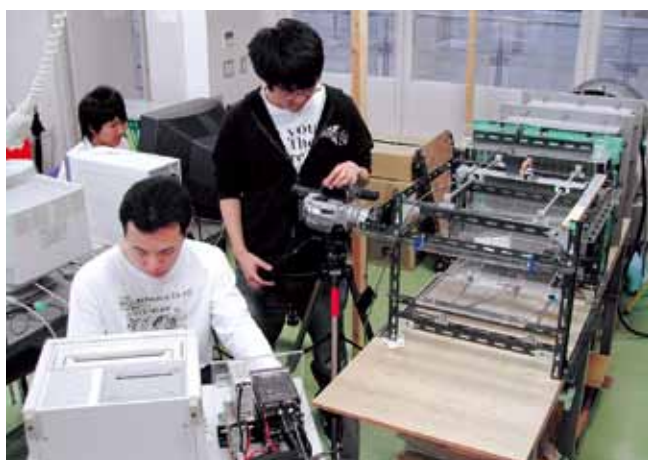
風洞実験による流体振動の計測 Wind-tunnel Experiment on Flow Induced Vibration