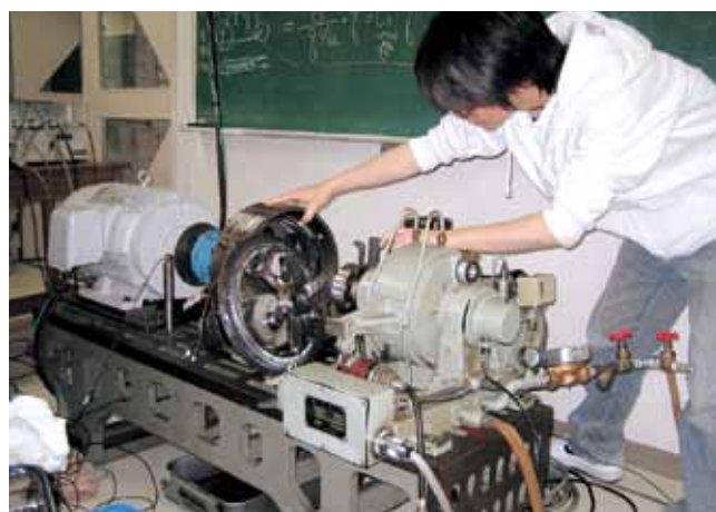
高速回転機の実験装置 Experimental apparatus of rotor dynamics