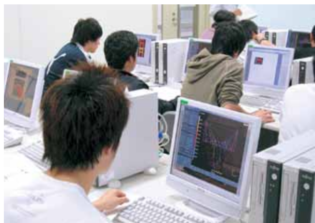
構造解析演習 Structural Analysis Training