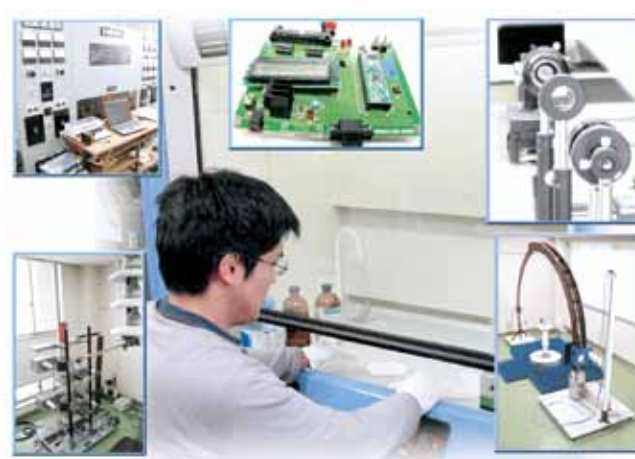
レーザー・半導体・放電・電磁解析システム Laser · Semiconductor · Discharge · Electromagnetic analysis system