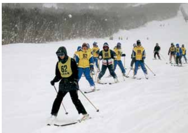
スキー合宿 Ski Camp