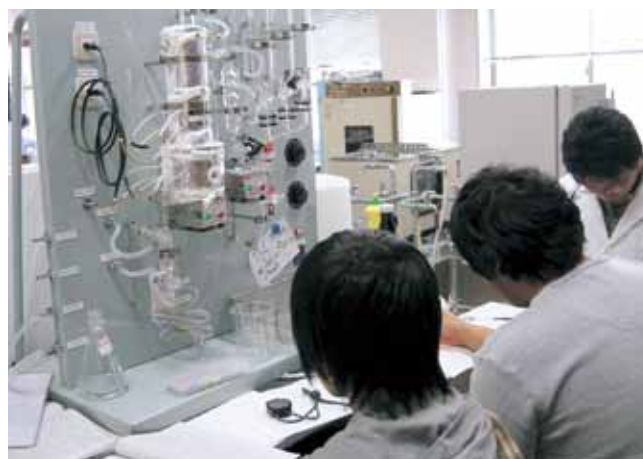
化学工学実験（5学年） Experiments of Chemical engineering (5th grade)