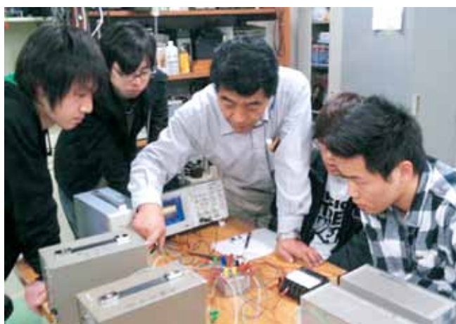
アナログ電子回路設計の実験（4学年学生実験） Experiment on Analog Electronic Circuit Design