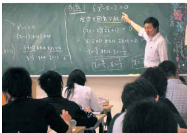
数学の授業 Mathematics Class