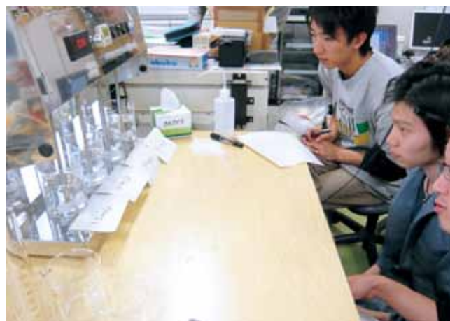
水環境工学実験 Water Engineering Experiment