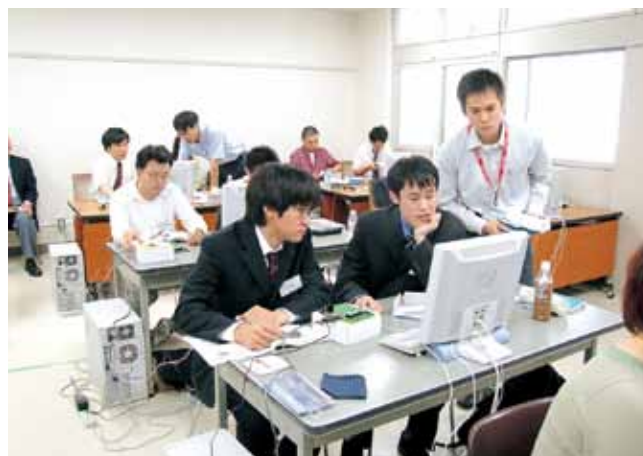
組み込みシステム技術者のための研修コース Training Course for Embedded System Engineer