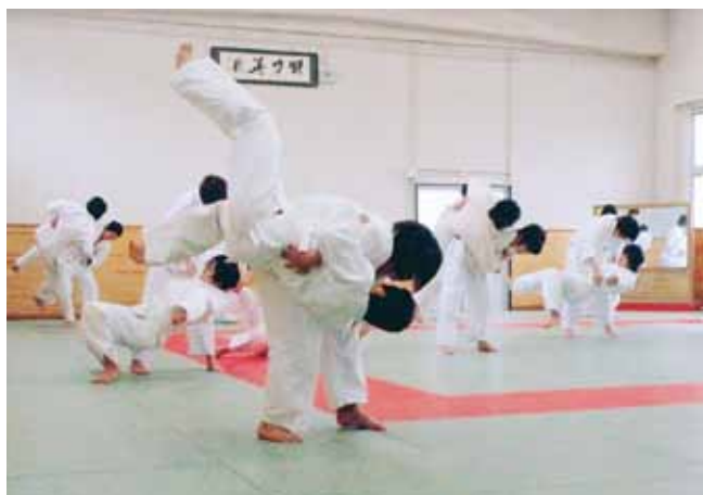
保健・体育（柔道）の授業 Physical Education(Judo) Class