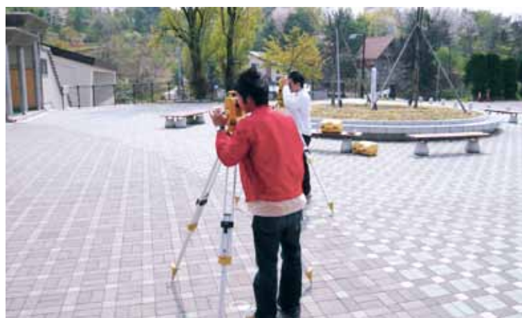
測量実習 Survey Training