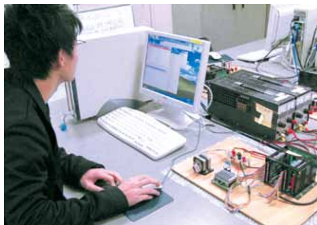
マイコン・システム開発の基礎実験（3学年） Fundamental Experiments of Microcomputer System Development (3rd grade)