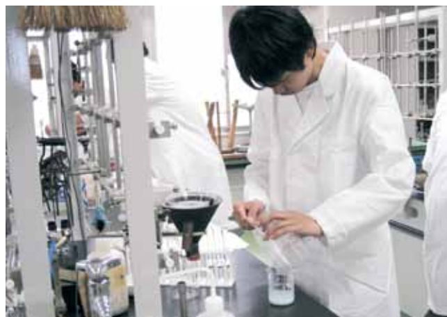
無機化学実験（3学年） Experiments of Inorganic Chemistry (3rd grade)