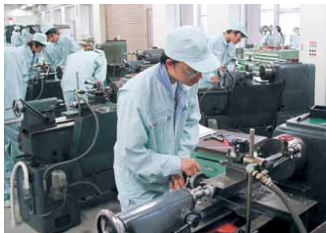
技能活用実習（機械工学実験実習・2学年） Manipulation practice (Experiments in Mechanical Engineering, 2nd grade)