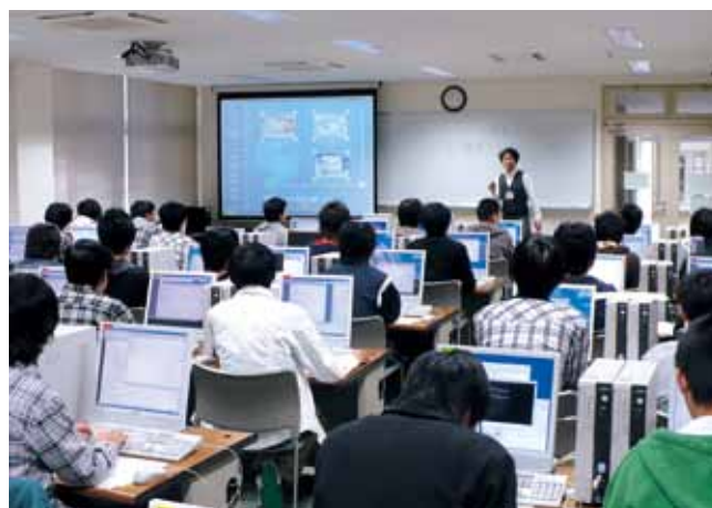
第1端末室授業風景 Class in the Computer Room 1