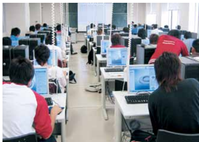
3次元CAD実習（3・4・5学年） Training in 3D CAD (3,4,5th grades)