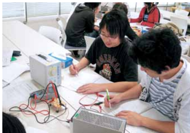
電子回路の実験（3学年） Experiments of Electronic Circuits (3rd grade)