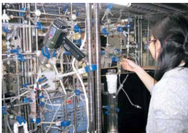
光触媒評価装置 Evaluation system for photo-catalysts