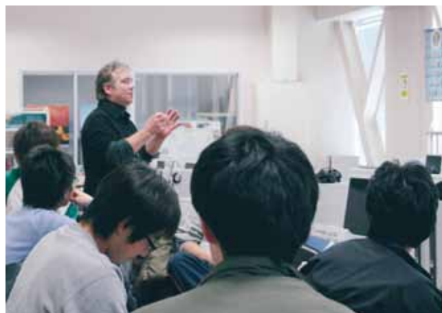
英語の授業 English Class