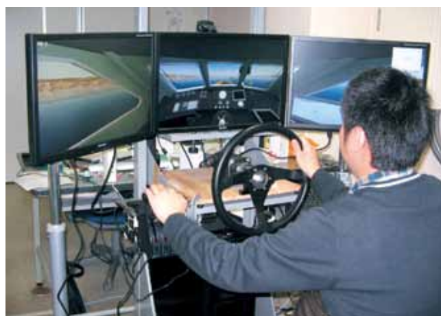
簡易操船シミュレータによる操縦性に関する研究 Study on Maneuver ability with Simplified Ship Simulator