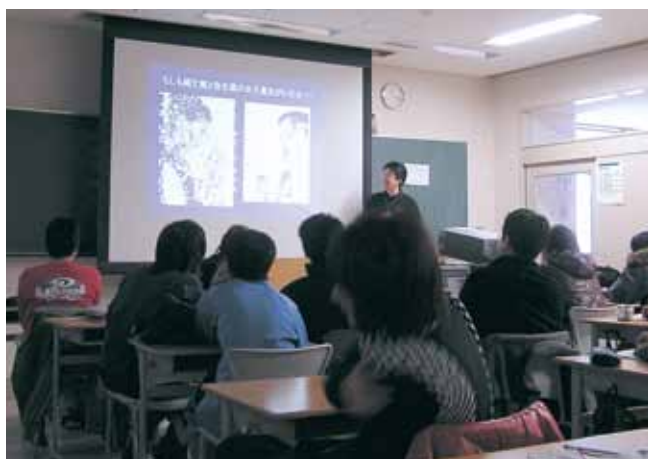
歴史の授業 History Class