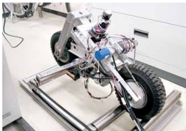
自立走行二輪車の安定化制御 Stabilizing Control of Self-Sustaining Two-wheeled Vehicle