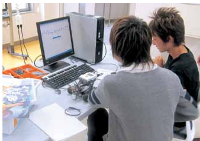
レゴ・マインドストームを用いたロボット作製実習 Robot Practical with LEGO MINDSTORM