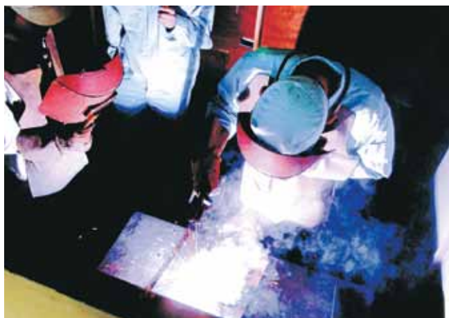
溶接実習（機械工学実験実習・1学年） Welding Training (Experiments in Mechanical Engineering, 1st grade)