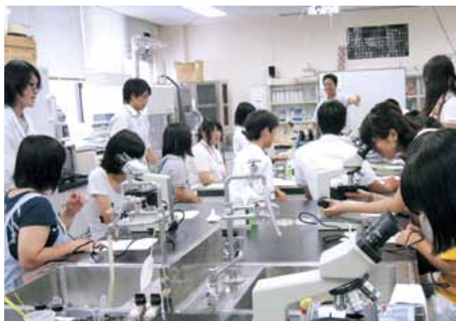
オープンキャンパス体験学習 On-the-job training in Open Campus