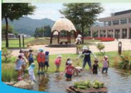
長岡市和島オートキャン プ場・うみまち森林公園