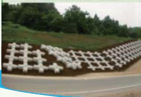
グラウンドアノカー工事