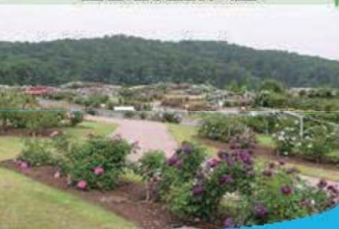
国営越後丘陵公園

成およびリニューアルや 築外構工事をやっており 木を大切に後世にまで伝 た人々にやすらぎを与え て潤いある空間づくりの